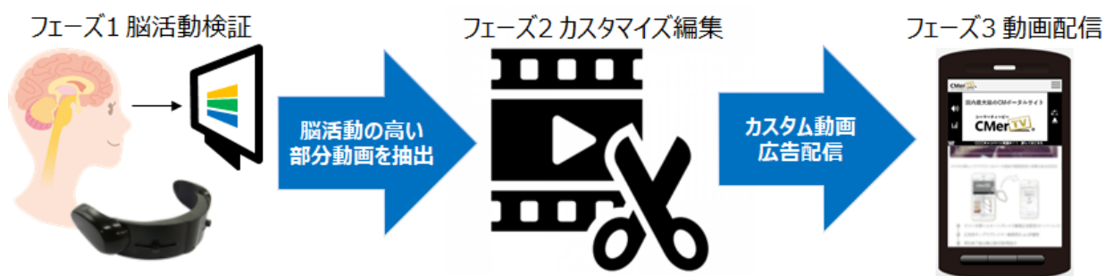
(図1)新ソリューション手法

本ソリューションでは、TV用の動画広告を事前検証し、脳活動の高かった部分を抽出したダイジェスト動画を作成します。通常のCM終了後にダイジェスト動画をリピートすることで、通常のCMのみを視聴した場合よりも高い脳活動を促し、動画広告の効果を高めることを目的としております。