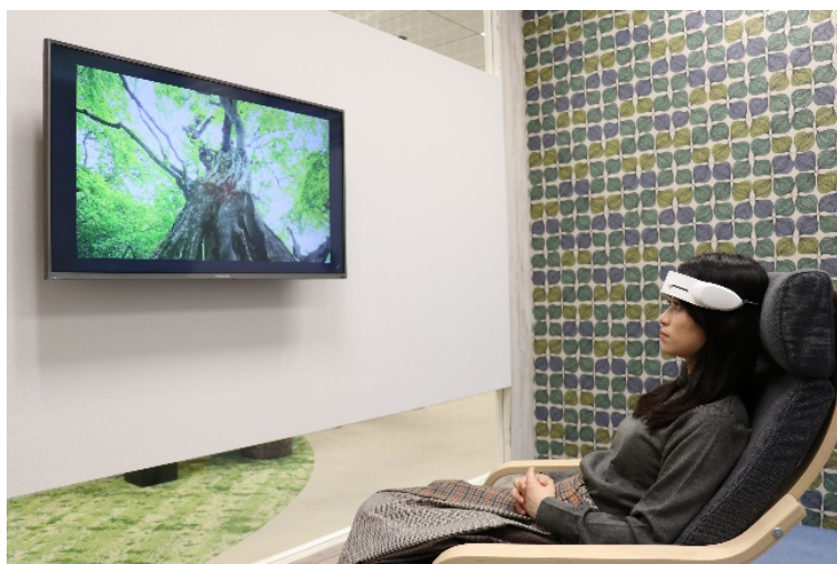
(図2) HOT-1000を付けてテレビを視聴する被験者